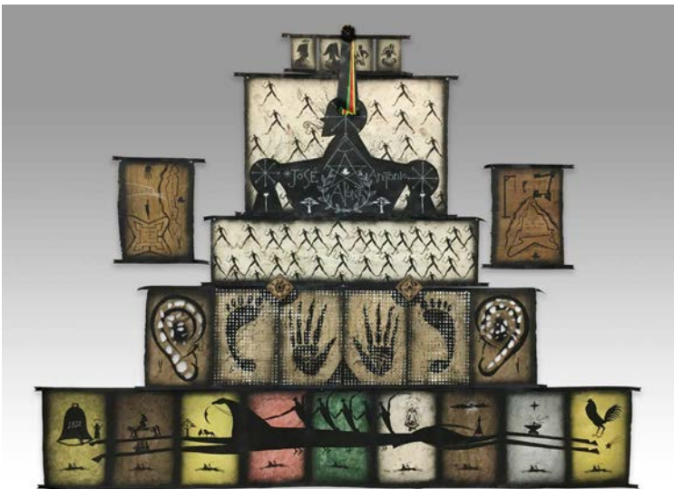
Júbilo de Aponte , 2017, técnica mixta sobre papel, 269 x 363 cm.

Júbilo de Aponte de Bedia responde a varias imágenes del Libro de pinturas , entre las que se encuentran el autorretrato de Aponte, la escena de batalla entre ejércitos de blancos y de negros, representaciones de las fortalezas de La Habana, la Virgen de Regla y el león abisinio. Bedia organizó la pieza para sugerir una construcción, un monumento o un mausoleo dedicado a la memoria de Aponte. Todos los elementos están entrelazados y unidos por un lazo negro. Lazos blancos son mencionados en varias ocasiones en el interrogatorio como uno de los objetos que las autoridades confiscaron en la casa de Aponte. En su pieza, Bedia cambia el color a negro, en alusión a un sentimiento de luto.