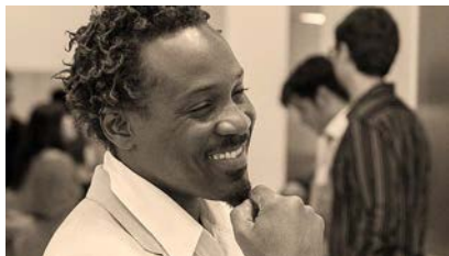
Asser St. Val Studio