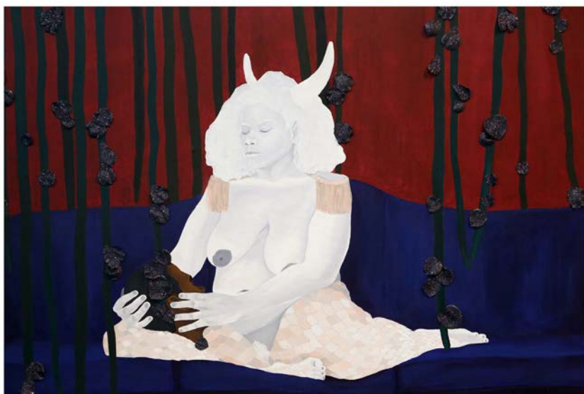
Goddess of memory , 2018. Acrílico sobre tela, 101.6 x 127 cm

El trabajo de Mars ha sido expuesto en los Estados Unidos, Canadá, Francia, Italia y, más recientemente, en la décima Bial de Berlín en 2018.