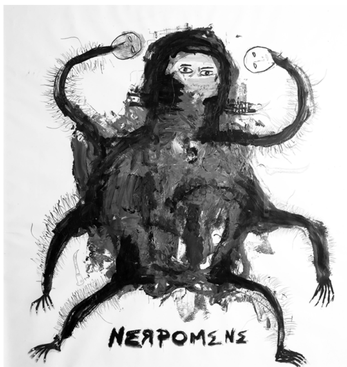
Nerpomene , 2018, técnica mixta sobre papel, 98 x 101 cm. Cortesía del artista.

La pieza de Martínez para Aponte visionario trabaja la figura de Nerpomene –la “diosa de las batallas”, en palabras de Aponte– quien aparece en la lámina 60 del Libro de pinturas . Martínez representa a Nerpomene como una criatura semejante a una bestia, como una figura-torbellino compuesta de muchos espíritus que la rodean y que han respondido a su llamado de guerra total contra un gobierno injusto. Esta pieza procura remontarse a la historia silenciada para exaltar a un heroico visionario, al tiempo que invita a otros a valorar la perspectiva y el legado de Aponte.