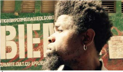
Átelier Jean-Marcel St. Jacques