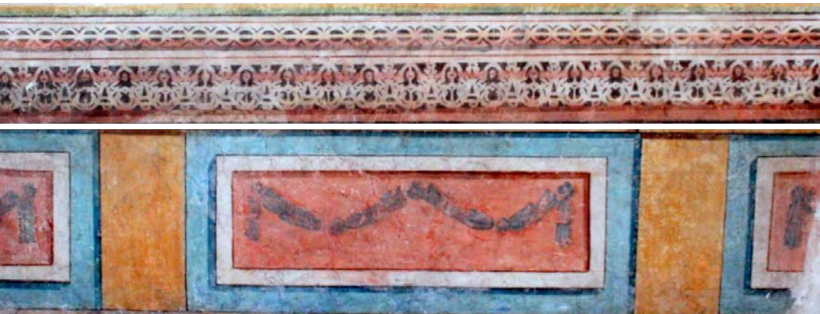
Artista desconocido, detalle, Calle Obrapia 112, principios del siglo xix, fresco o semi-fresco[?]