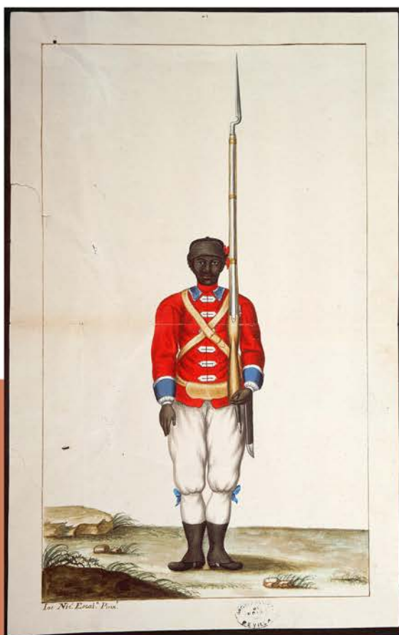
José Nicolás de Escalera. Uniforme del Batallón de Morenos de La Habana, 1763.

José Antonio Aponte, habanero criollo, negro y libre, fue también carpintero, soldado y artista.