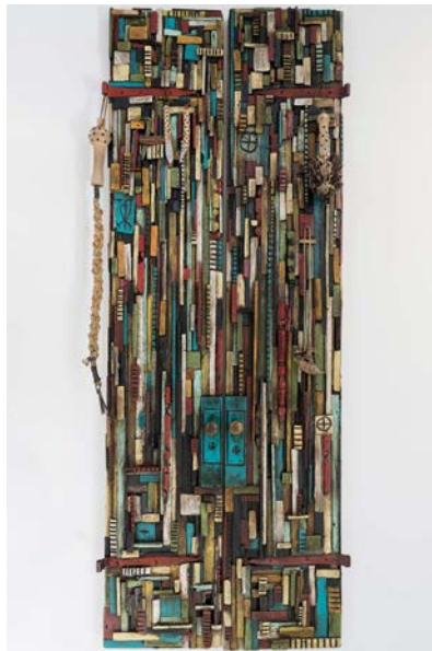
Portal for Aponte , 2017, Técnica mixta sobre puerta rescatada con 5 armas fabricada por el artista Odinga Tyehimba en colaboración con el artista en homenaje a la Sociedad Abakua, 244 x 84 x 18 cm.

La puerta de Jean-Marcel —creada en colaboración con la obra de Renée Stout para esta exposición— es un altar en homenaje al espíritu de Aponte. Pero también es un cruce o portal entre el mundo de los mortales y el de los espíritus, que invita a la energía de Aponte a entrar para ayudar a la diáspora africana en su continua lucha por el derecho de sus miembros a ser ellos mismos. Funciona, asimismo, como símbolo de nuestra habilidad para abrir la puerta a nuevas posibilidades cuando descubrimos el poder que tenemos para crear un mundo mejor para nosotros. Toda la madera utilizada en esta obra fue tomada del hogar de St. Jacques, siniestrado por el huracán Katrina en el vecindario Tremé,