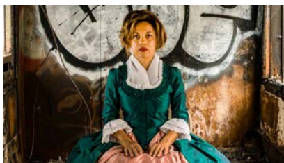
Marielle Plaisir Studio