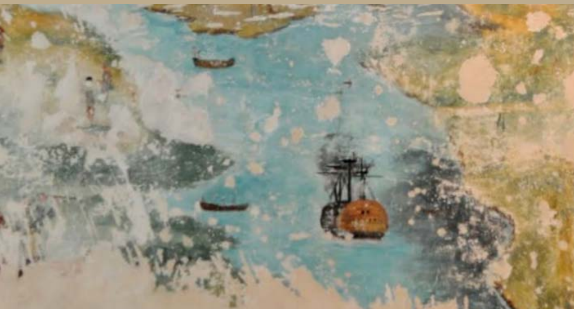
Artista desconocido, detalle, Calle Tacón 12, c. 1762-1768, fresco o semi-fresco [?], pintura mural