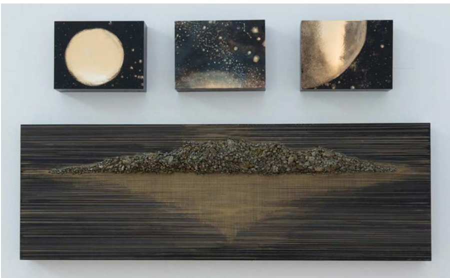
Aponte (Láminas 10-11) , 2017, pirita, óleo y grafito sobre panel de madera, 55 x 91 x 5 cm. Cortesía de la artista y Lehmann Maupin, Nueva York.