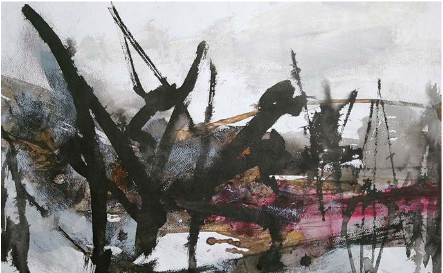
Las Lagunas del Infierno 2019, 50 x 70 cm, mixta/cartulina

Robo de Proserpina es la evocación en lenguaje abstracto figurativo de esa tierna y trágica leyenda.