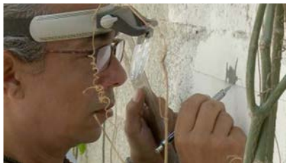
Glexis Novoa Studio