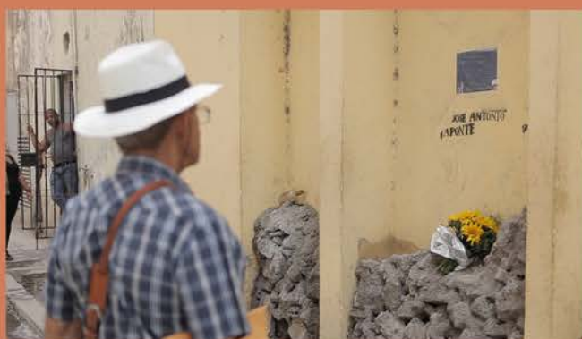
Conmemoración de la muerte de Aponte, La Habana, 2013.