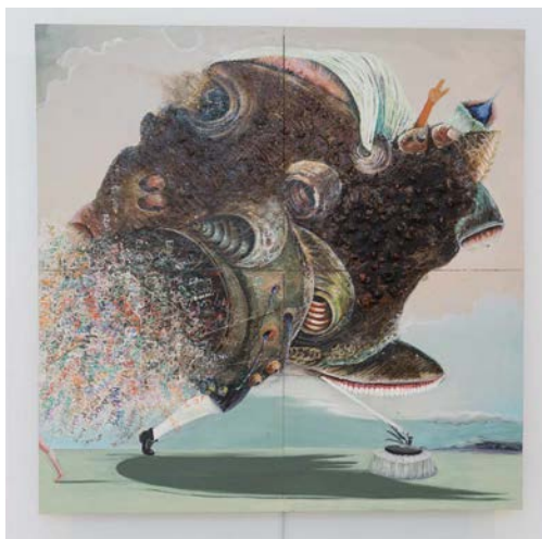
José Antonio Aponte, Ada Ferrer, Freedom's Mirror ... , 2017, Técnica mixta con movimiento cinético sobre masonita, 4 paneles de 61 x 61 cm.

En su acercamiento al testimonio y el Libro de pinturas de Aponte, Saint-Val se interesa particularmente por el modo en que Aponte utiliza la mitología griega. Como estudioso, artista y genio adelantado a su tiempo, Aponte explora las ideologías de los dioses y las diosas griegas como una herramienta de transformación, empoderamiento y revolución. Saint-Val también considera que Aponte utilizó estas figuras para establecer vínculos consigo mismo como entidad espiritual, anticipando así una nueva filosofía afrocéntrica en la cual estudiosos negros trazan la génesis de los pueblos con melanina hasta la Atlántida y Lemuria, el pueblo Dogón y la estrella Sirio.