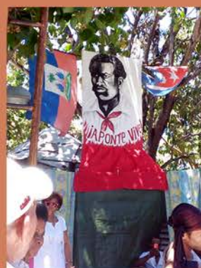
Bandera Aponte Vive, Misterios del Vudú, La Habana, 2017.

En la Cuba del siglo XX, la frase "más malo que Aponte" era un insulto común. A pesar de ello, muchas personas se inspiraron en el ejemplo de Aponte y mantuvieron viva su memoria a lo largo del tiempo. En los años treinta, se le puso el nombre de Aponte a la antigua calle Someruelos, el nombre del gobernador español que lo había condenado a muerte. En los cuarenta, se inauguró una placa conmemorativa en La Habana. Actualmente, la Comisión Aponte desarrolla programas culturales de lucha contra la discriminación.