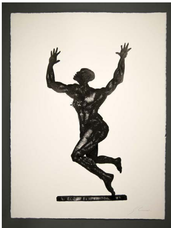
Fatalidad , 2016, Dibujo con Tinta Sumi sobre papel Arches, 76 x 56 cm.