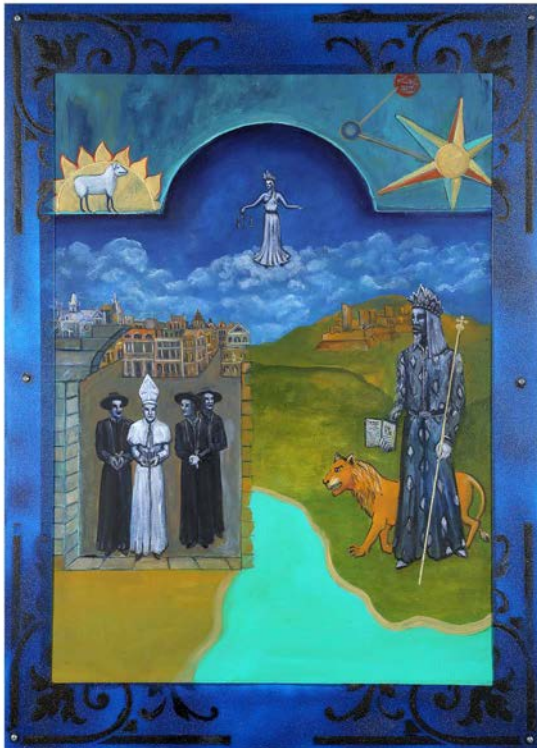
Prester John and His Emissaries , 2017, técnica mixta sobre papel, 91 x 66 cm. Cortesía del artista y Lyle O. Reitzel Gallery (Santo Domingo y Nueva York).