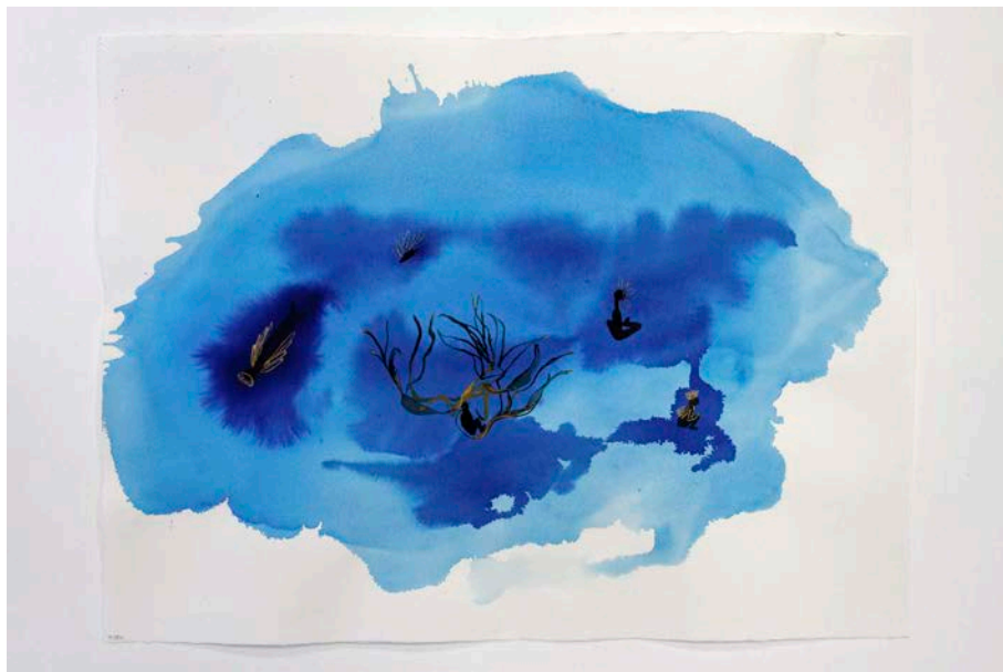
Cinco Apariciones , 2019. De la serie Un Pedazo de Mar . Acuarela, tinta, y gouache sobre papel, 56.5 x 76 cm.

Las obras de Campos Pons se encuentran en más de 30 colecciones de museos, incluyendo la Smithsonian Institución, el Whitney, el Art Institute de Chicago, la Galería Nacional de Canadá, el Victoria and Albert Museum, MOMA (Nueva York), the Museum of Fine Arts, Boston, y el Pérez Art Museum en Miami, entre otros. Ha realizado exposiciones individuales en el MOMA de Nueva York, el Museo de Arte de Indianápolis, el Museo Peabody Essex y la Galería Nacional de Canadá, y otras instituciones distinguidas. Ella ha presentado más de 30 actuaciones encargadas por instituciones como la Guggenheim y el National Portrait Gallery del Smithsonian. Ha participado en la Bienal de Venecia, la Bienal de Dakar, la Bienal de Johannesburgo, Documenta 14, la Trienal de Guangzhou y está incluida en Pacific Standard Time: LA / LA y Prospect.4 Triennial. En octubre de 2017, recibió la Cátedra Cornelius Vanderbilt en la Universidad de Vanderbilt en Nashville, Tennessee.