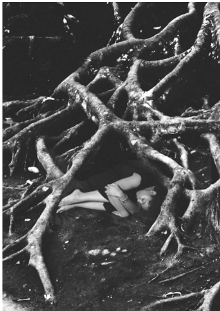
Invocation for José Antonio Aponte: Lámina 26 , (fotograma), 2017, video digital con audio.

Invocación para José Aponte de Mercer invoca la energía que animó a Aponte a canalizar la palabra y transformarla en un manifiesto transnacional visual de liberación. Mercer también llama a las multitudes ancestrales en el umbral y lugar de nacimiento de la diáspora –el océano, Yemonja, Mami Wata, Nuestra Señora de Regla– y trasciende el tiempo y las aparentes fronteras nacionales. “Estamos aquí ahora, y antes de antes; somos futuro y la encarnación viva de cosmologías sagradas que siempre regresan para llevarnos adelante”, dice Mercer.