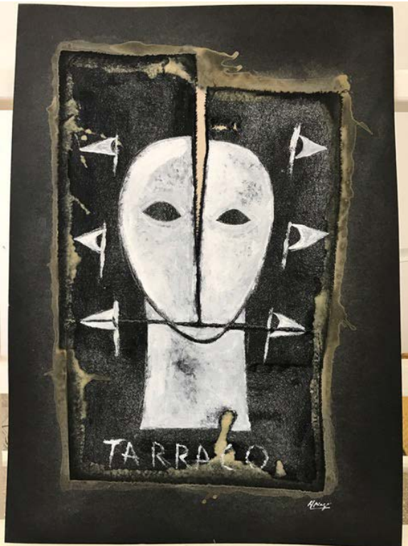
Tarraco , 2017, técnica mixta sobre tela y cartulina, 86 x 56 cm. Cortesía del artista y Pan American Art Projects, Miami.

Tarraco de Diago se refiere a las láminas 44b-445 del Libro de pinturas de Aponte. Se inspira en Aponte, dice el artista, “porque Aponte es un guerrero, un ángel de resistencia y de amor”.