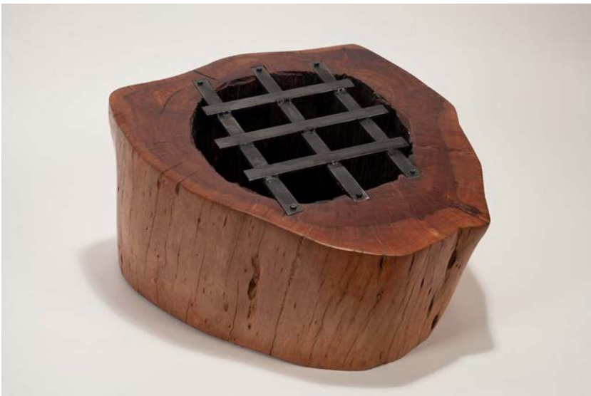
El roble noble. 2018, roble, acero soldado y arena negra, 26 x 44.5 x 46 cm.

La descripción de Aponte de las láminas 24-25 del Libro de pinturas inspiró a Martínez a trabajar con una gran pieza de roble. A lo largo de la historia, el roble es símbolo de gran fortaleza, sabiduría, resistencia y nobleza, todas cualidades que Aponte representa. En su investigación, Martínez descubrió que los primeros exploradores españoles estaban tan enamorados de los bosques naturales de Cuba, que llevaron de regreso con ellos varias especies. Otro elemento de la pieza, el acero soldado cruzado, simboliza el aprisionamiento de todos los hombres de color, y el dolor y el sufrimiento de los esclavos, infligido a menudo con cadenas y grilletes. La forma de la pieza, de cuerpo redondo, con una cavidad y barras de acero, se refiere al fin espantoso que Aponte sufrió. La fina arena negra en la cavidad representa las profundidades del infierno viviente al que fue sometido el hombre negro e invoca la industria azucarera en Cuba, el catalizador del comercio de esclavos en la isla.