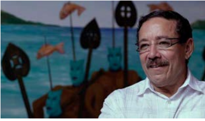
Associated Press 2009