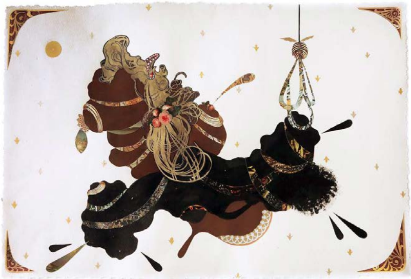
Lámina 35 significa el sueño... , 2017, acrílico, pintura metálica y collage sobre papel BFK Rives, 38 x 56 cm.

En la pieza titulada Lámina 35 , las figuras antropomórficas representan a una hembra y un varón (José Antonio Aponte) reposando en estado onírico. Las figuras lucen joyas y están atadas por elementos del mundo natural que evocan la fe yoruba, religión que se cree Aponte practicaba. El largo de la sogá que rodea a la figura negra presagia la captura de Aponte a manos del gobierno español en Cuba, así como el posterior ahorcamiento y decapitación del líder revolucionario.