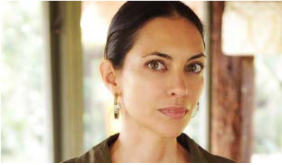
Teresita Fernández Studio