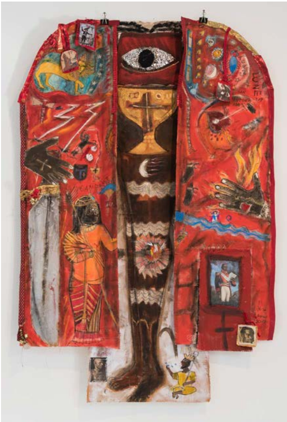
El Preste Juan , técnica mixta sobre tela, 183 x 122 cm. Colección privada.

Clara Morera estudió en la Escuela Nacional de Artes Visuales y se graduó de la Academia San Alejandro, ambas en La Habana, en la especialidad de pintura. Ha trabajado en una variedad de disciplinas, incluidas la tapicería, la escultura blanda, el dibujo y las instalaciones multimedia. Morera es miembro de los grupos Afro-Cuban Art y Grupo Antillano. Su obra formó parte de la exposición del Grupo Antillano, Drapetomania , en el Museum of the African Diaspora (MoAD, San Francisco, CA). También ha expuesto su obra en colecciones públicas de renombre, tales como la del Museum of the Americas en Washington, DC (1992); el Museo Nacional de Bellas Artes de La Habana (1970); y, recientemente, en Castle Galleries, New Rochelle College (Nueva York); el Lyman Museum (Connecticut); el Newark Museum (New Jersey); el Lowe Museum of Art, University of Miami (Florida); y la Ethelbert Cooper Gallery of African American Art, Harvard University, Cambridge (Massachusetts). Su obra ha sido reseñada en Small Axe: A Caribbean Journal of Criticism y en Revue Noire , entre otras publicaciones. “Una característica específica de la obra de Morera”, escribe la crítica Ana Belén Martín Sevillano, “es la representación recurrente de figuras femeninas...en posturas poco convencionales, como un intento de vencer el imaginario tradicional.”