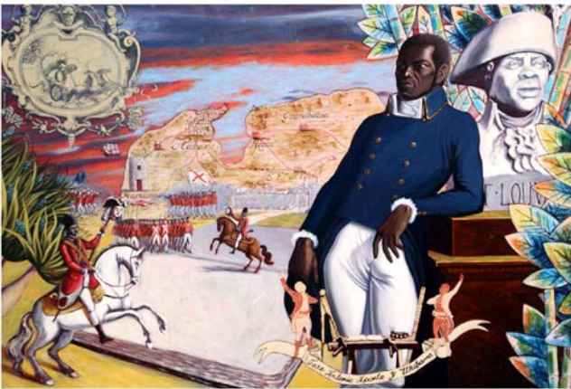
Como fuego arde en vivas llamas 2018, acrílico sobre tela, 140 x 200 cm.

Como fuego arde en vivas llamas interpreta la certeza de Aponte de que no se podría lograr una emancipación efectiva y duradera sin la construcción y la defensa de un relato histórico racial con valores positivos, que generara autoestima colectiva. La autocreación de su identidad personal en el retrato de su libro perdido de pinturas (su autorretrato) fue irreconocible para la mirada arrogante y sarcástica de sus captores. La obra es imaginada por el artista, tal vez, como una venganza contra sus verdugos, buscando el parecido en lo invisible, en las esencias, no en las apariencias, reconstruyendo un rostro posible entre tantos rostros apócrifos de Aponte y reencarnándolo en el cuerpo de Jean Baptiste Belley, hurtado con toda intención del cuadro de Girodet, para apropiarse tanto de su retórica original como de sus relecturas contemporáneas. Pretende establecer una conexión entre los antecedentes políticos y humanos que formaron e inspiraron al carpintero del barrio habanero de Guadalupe, su realidad y nuestro presente.