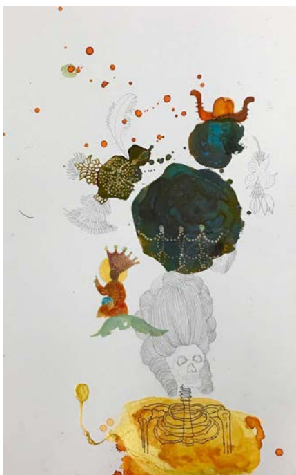
Aponte, Lámina 23, 2017, Tintas, pigmento oro, lápiz sobre Papel 300g, 46 x 30 cm.

Plaisir se interesó por la historia de Aponte –la cual consideró irreal, hermosa, poética, formidable, trágica y cruel– y por Aponte el hombre, a quien imaginó como un personaje lleno de santidad, bondad y humanidad. Su serie de dibujos El libro de la vida , no representa ninguna página en particular del Libro de pinturas . Más bien, evoca el modo en que Aponte escapa del mundo a través de una deconstrucción de su tiempo y lugar, recorriendo la mitología, la religión, la muerte, la guerra y el amor. Para Plaisir, el Libro de pinturas representa una especie de exilio hermoso, un proceso de soñar un mundo mejor.