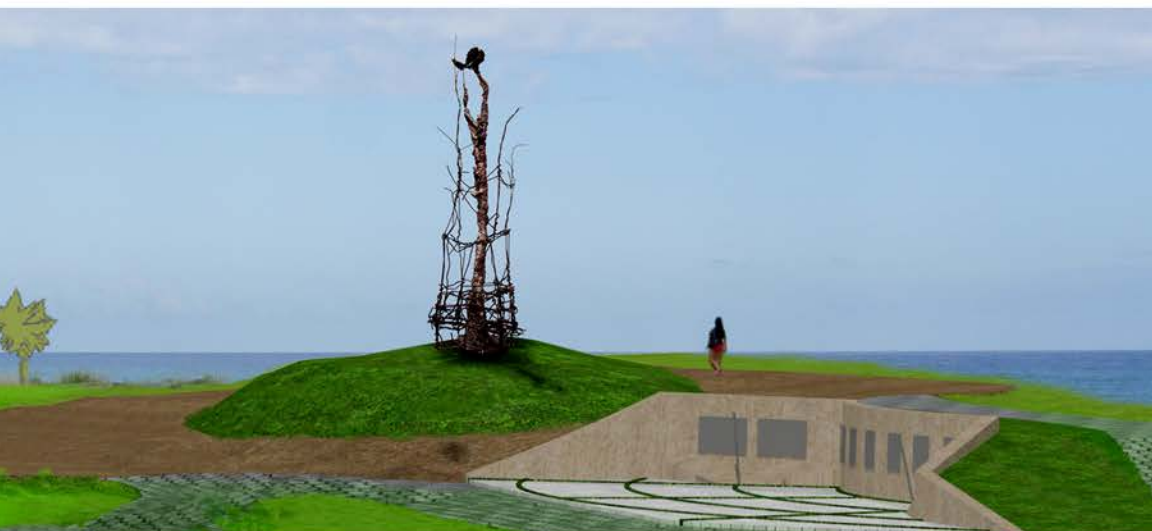
Regreso de Aponte, proyecto para un monumento a Aponte.