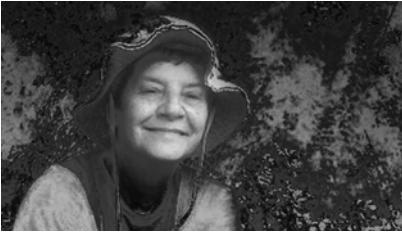
Clara Morera/Dorfsman Fine Arts