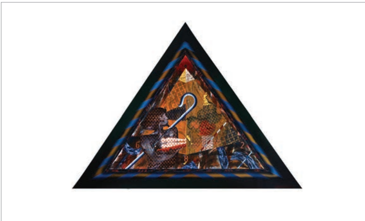
Lamina No. 42 Testimonio de Aponte , 2019. Técnica Mixta/Cartoncillo, 104 x 84 cm. Cortesía de la artista.

Su pieza se inspira en el testimonio que dio Aponte sobre su lámina no. 42, que representa las pirámides de Egipto. Arrate intenta recrear lo que narró Aponte, recontextualizando y apropiándose del ambiente faraónico con la simetría y la síntesis de las formas que tan magistralmente aplicaron los egipcios en su vida cotidiana. Ubica en su obra las tres grandes pirámides una dentro de la otra con una geometría perfecta. La textura almenada simboliza la cercanía y las mezclas de las civilizaciones que conviven y se conectan en espacio y tiempo. El pan de oro de tonos azules y metálicos representa la suntuosidad y la riqueza de esa civilización; los números y las líneas rectas y circulares se vinculan al conocimiento matemático y al dominio de las proporciones exactas con las que se calcularon y erigieron esas magníficas edificaciones que han llegado hasta nuestros días. Con el uso de materiales y herramientas contemporáneas intenta traer a nuestro tiempo el lenguaje y el legado de esa civilización y, a la vez, traducir desde su óptica el pensamiento de Aponte.